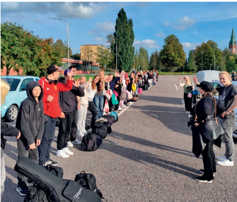
Nuoret valmiina isosleirille, "väestönlaskennassa" rivit suorina.

Syksy on omalta osaltani kulunut vauhdikkaasti ja olen iloinnut hyvästä vastaanotosta, hienoista kohtaamisista lasten ja nuorten kanssa, uusista työkavereista ja mukavasta meiningistä! Tästä on hyvä jatkaa! Tapaamisiin!