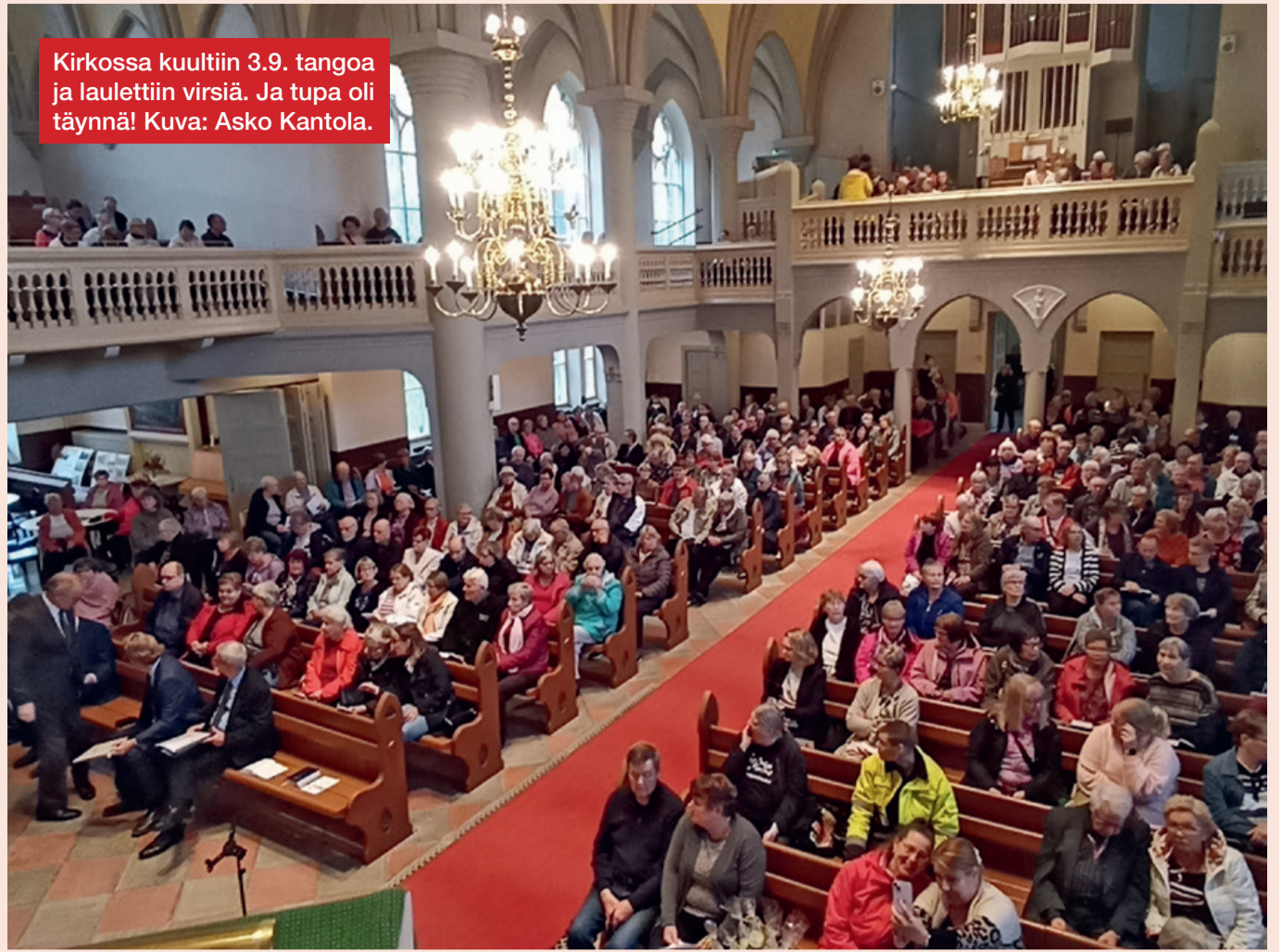
Kirkossa kuultiin 3.9. tangoa ja laulettiin virsiä. Ja tupa oli täynnä!