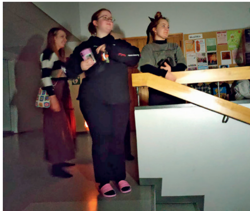
Pimeässä oli hyvä olla piilosilla.