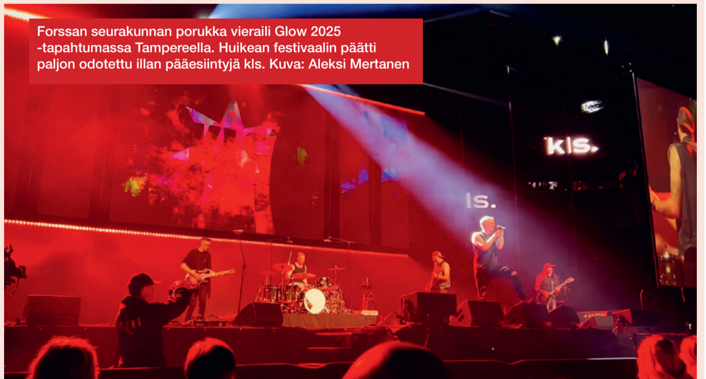
Forssan seurakunnan porukka vieraili Glow 2025 -tapahtumassa Tampereella. Huikean festivaalin päätti paljon odotettu illan pääesiintyjä kls.