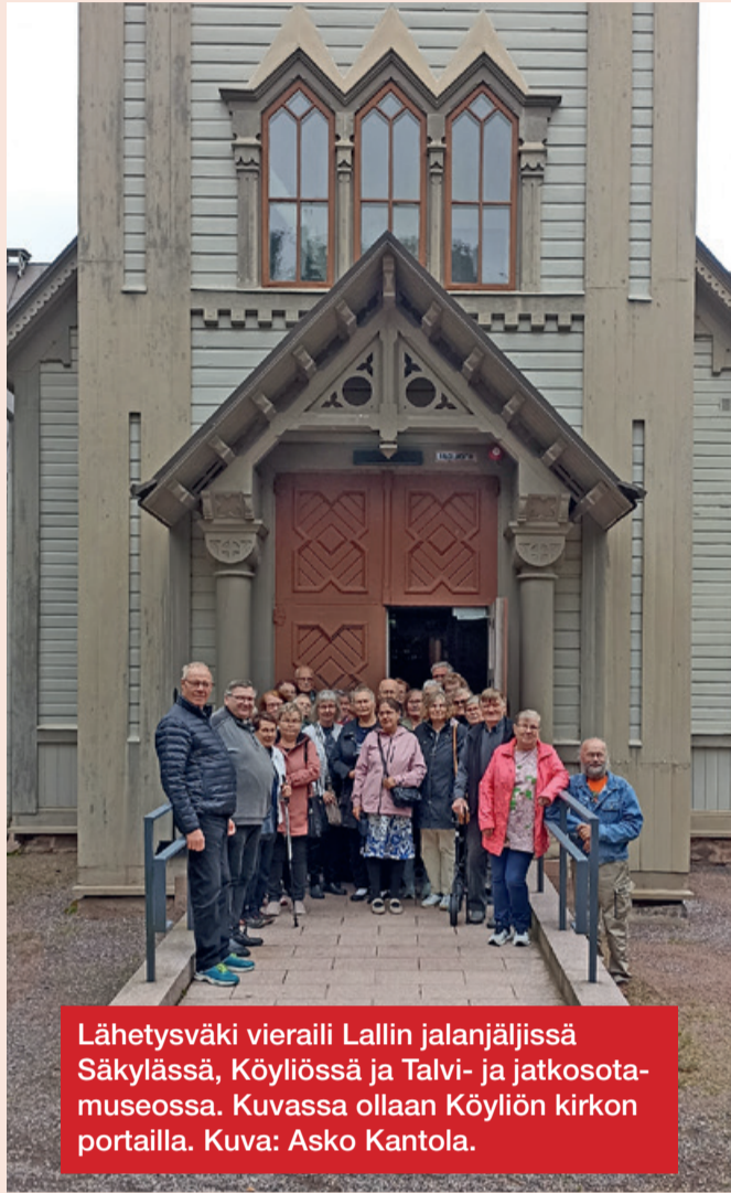
Lähetysväki vieraili Lallin jalanjäljissä Säkylässä, Köyliössä ja Talvi- ja jatkosotamuseossa. Kuvassa ollaan Köyliön kirkon portailla.