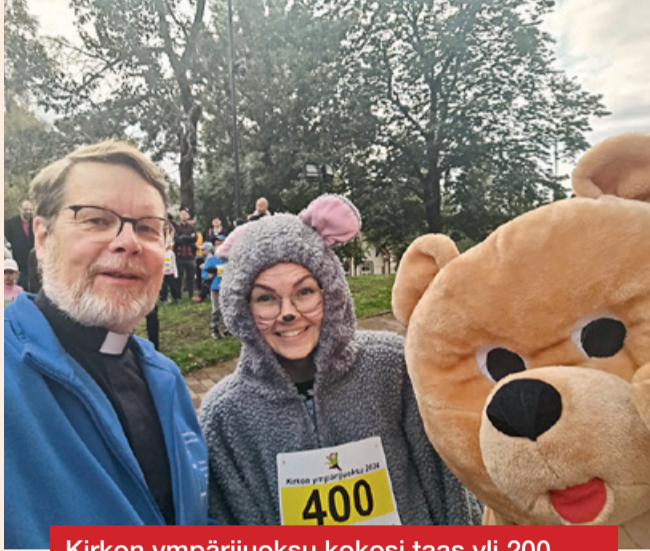
Kirkon ympärijuoksu kokosi taas yli 200 juoksijaa. Heidät siunattiin matkaan kirkossa ja kaikki saivat mitalin. Mukana menossa olivat myös kirkonrotta ja Salama-nalle.