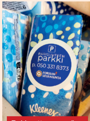
Rakkautta on myös lähteä kumppanin kanssa parisuhteen parkkihetkeen.