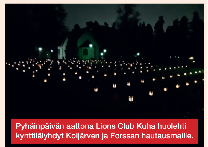
Pyhäinpäivän aattona Lions Club Kuha huolehti kynttilälyhdyt Koijärven ja Forssan hautausmailla.