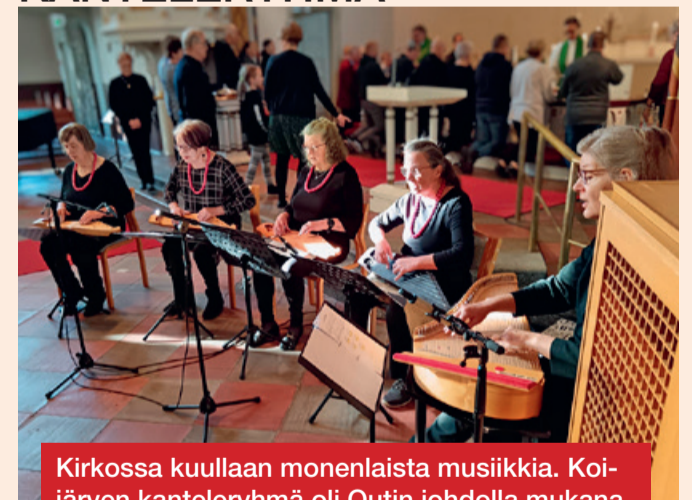
Kirkossa kuullaan monenlaista musiikkia. Koijärven kanteleryhmä oli Outin johdolla mukana messussa.