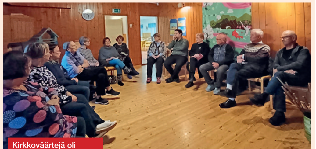
Kirkkoväärtejä oli syyskuuisena iltana Klemelässä koolla. Väärtejä avustavat messussa eri tehtävissä. Kuin yhdestä suusta todettiin tehtävän olevan innostava.