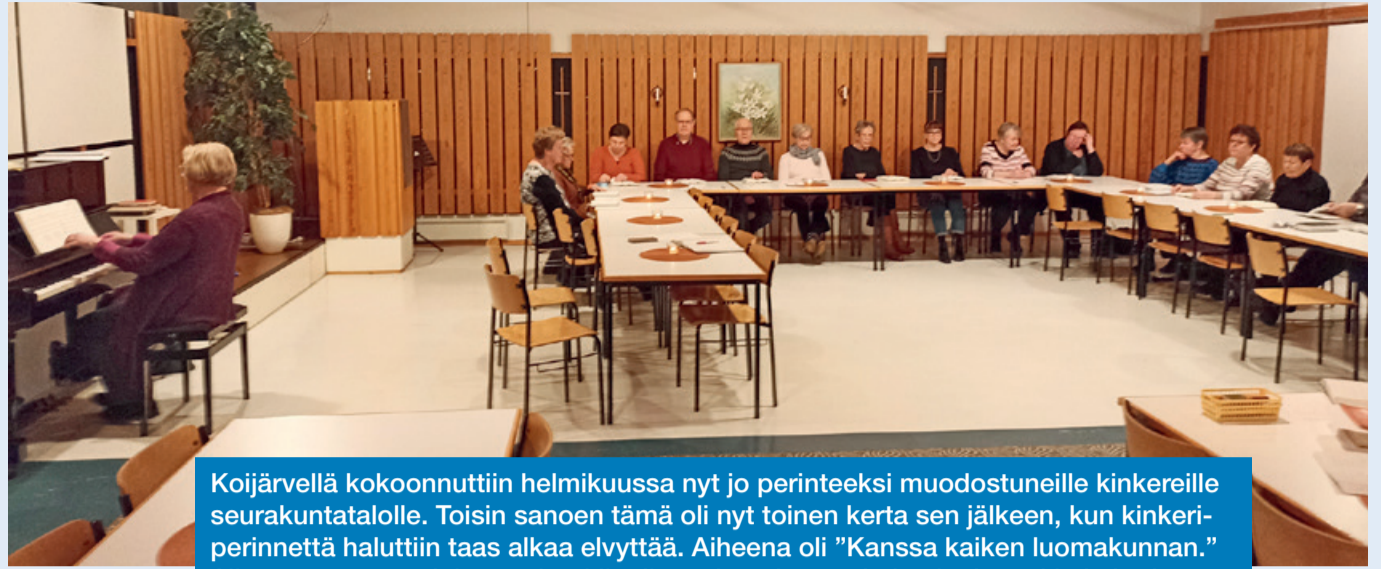
Koijärvellä kokoonnuttiin helmikuussa nyt jo perinteeksi muodostuneille kinkereille seurakuntatalolle. Toisin sanoen tämä oli nyt toinen kerta sen jälkeen, kun kinkeri-perinnettä haluttiin taas alkaa elvyttää. Aiheena oli "Kanssa kaiken luomakunnan." Aiheeseen paneuduimme tietokilpailun, alustuksen, virsien ja tietysti kahvitellun myötä. Kolehti kerättiin Yv-keräykselle. Ja mukavaahan meillä oli. Ja ensi vuonna varmasti jatketaan.