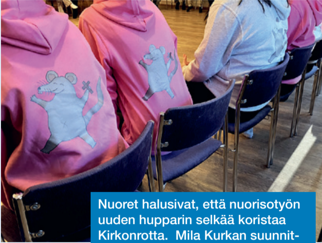
Nuoret halusivat, että nuorisotyön uuden hupparin selkää koristaa Kirkonrotta. Mila Kurkan suunnittelema Kirkonrotta tulee jatkossa seikkailemaan mm. erilaisissa mainoksissa.