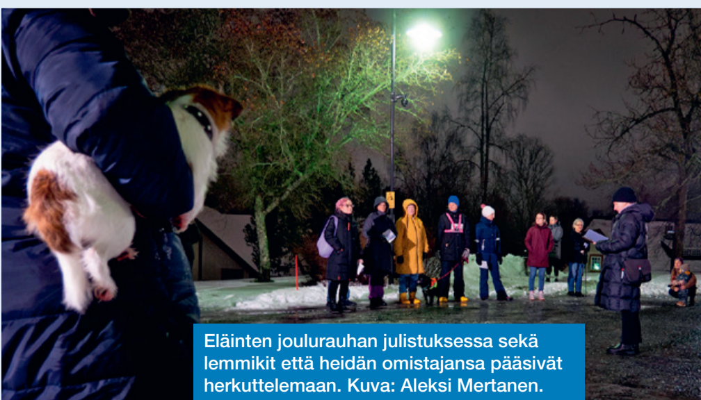
Eläinten joulurauhan julistuksessa sekä lemmikit että heidän omistajansa pääsivät herkuttelemaan.