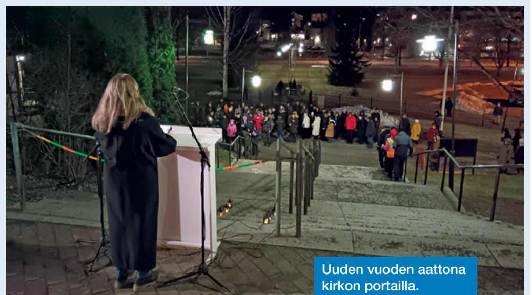
Uuden vuoden aattona kirkon portilla.