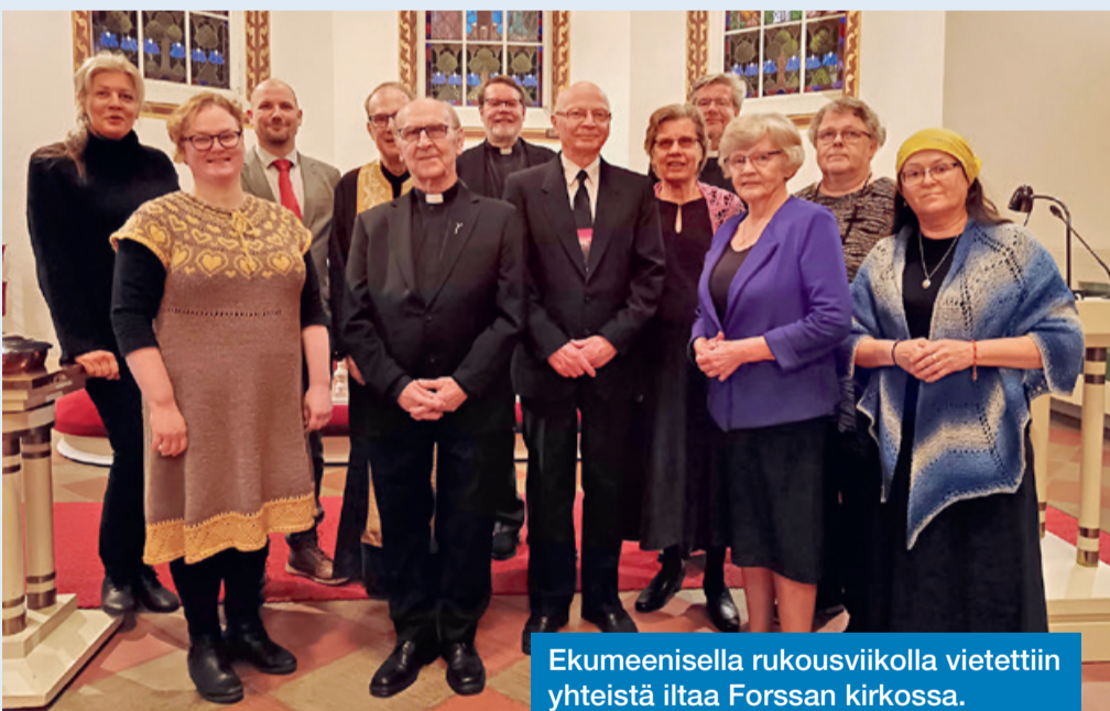
Ekumeenisella rukousviikolla vietettiin yhteistä iltaa Forssan kirkossa.