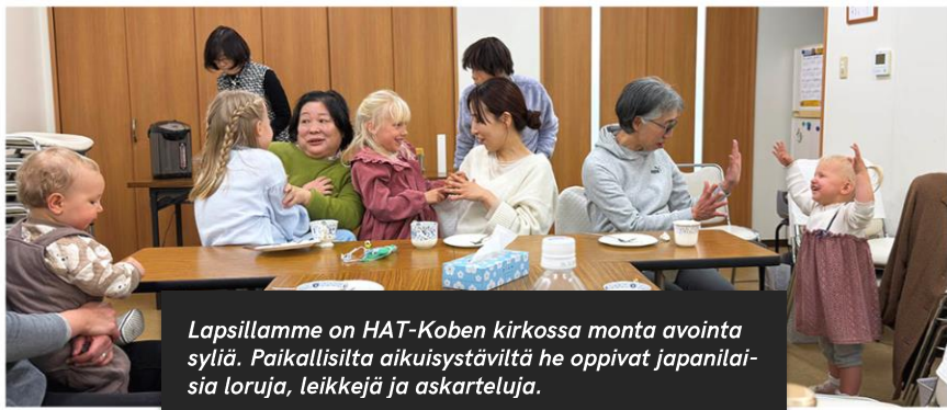
Lapsillamme on HAT-Koben kirkossa monta avointa syyliä. Paikallisilta aikuisystäviltä he oppivat japanilaisia loruja, leikkejä ja askarteluja.