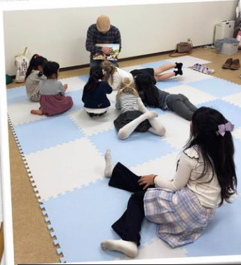
Englannin leikki-piiriin raamatunkertomustuokio. Tässä kuussa on viimeinen kerta.