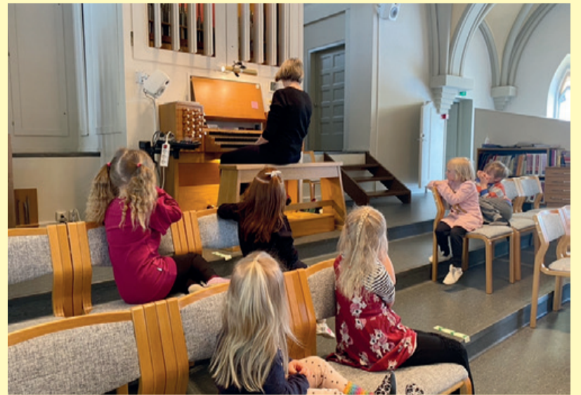
Sitten kuunnettiin erilaisia ääniä. Ankanpojat sekä äiti- ja isiankka vaakuivat menemään urkujen hassuilla äänikerroilla. Norsujen hurjat bileet soitettiin 16-, 8-, 4-, 2- ja 4x-jalkaisilla äänikerroilla.

Eskarilaiset ja päiväkerholaiset kävivät keväällä kurkkaamassa muuallekin kirkkoon ja oppivat kirkosta, papista ja suntiosta vaikka mitä hienoja asioita!