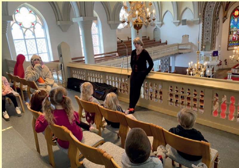
Urkuparvella oli ensin urkujen esittely. Päiväkerhon lapset muistavat, että urut ovat kuin lego-talo. Ne tuodaan kirkkoon pieninä palasina ja kootaan parvella isoksi soittimeksi.