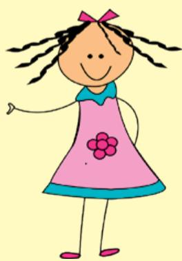
Pupukin pääsi myös kokeilemaan urkujen soittoa yhdessä lasten kanssa. Se olikin outoa, että myös jaloilla soitellaan. Ihan vahingossa syntyi musiikkia, kun kiipesi urkupunille.

Eskarilaiset ja päiväkerholaiset kävivät keväällä kurkkaamassa muuallekin kirkkoon ja oppivat kirkosta, papista ja suntiosta vaikka mitä hienoja asioita!