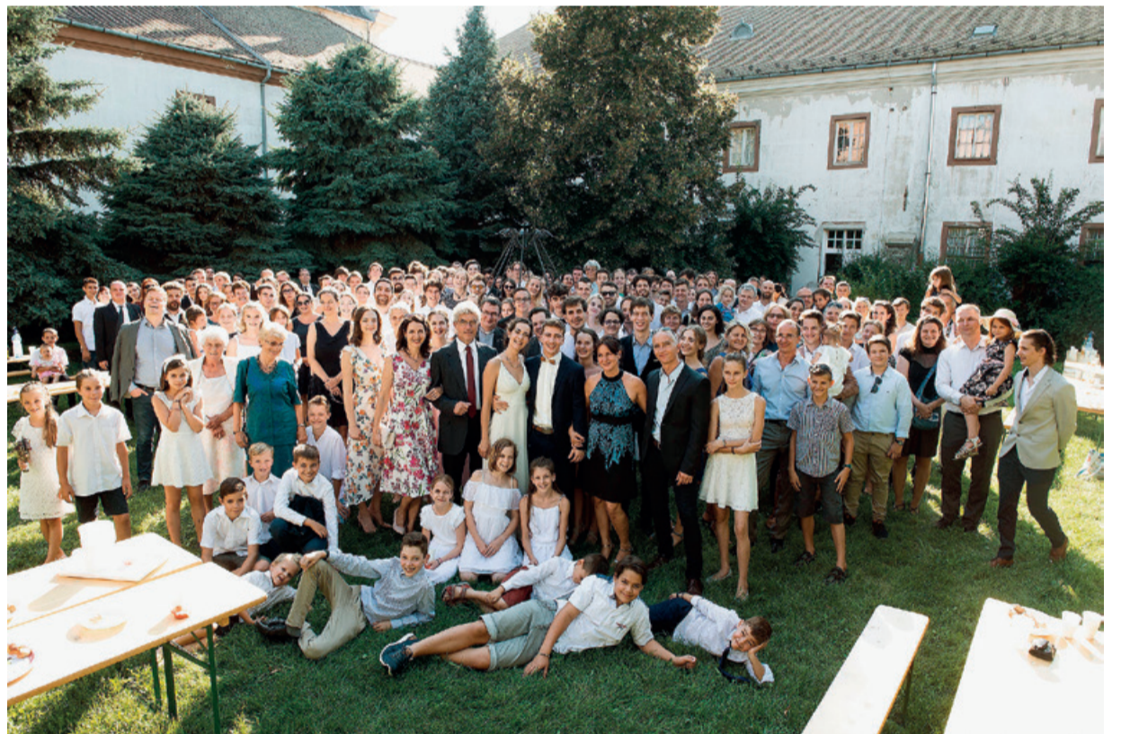
Perheen häjäjuhla elokuussa 2020.

Perheen tyttäristä kaksi opiskelee musiikkia ulkomailla ja tullessaan lomalle vuosi sitten he jäivät kotiin asumaan, kun vain etäopiskelu oli mahdollista. – ”Kolme kuukautta elimme kuin perhero-