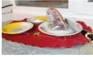
Varsanlihaa sekä suola ja pippuria.

vuonna syödään hyvin perheen kanssa, annetaan lahjoja, presidentin uuden vuoden toivotuksen jälkeen lähdetään ampumaan ilotulitteita ja kyläilemään. Ortodoksikristityt viettävät joulua 7.1. Muissa kristillisissä kirkoissa on vaihtelevia perinteitä, joissakin vietetään vallitsevan kulttuurin mukaisesti tammikuussa joulua, toiset viettävät kahteen kertaan ja toiset meille suomalaisille tutusti joulukuussa.