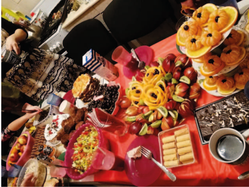
Viime joulun jouluateriakattaus Jakutskin seurakunnasta.

Inkerin kirkon kalenterin mukaan joulu on 25.12., jolloin olemme seurakuntana viettäneet joulua. Joulun aikana on pidetty usein kaksi juhlaa, toinen jouluaattona ja toinen joulupäivänä. Toinen tilaisuuksista on joulujumalanpalvelus, jonka yhteydessä on, kuten tavallisesti jumalanpalveluksen jälkeen, ateriat. Joulujuhlissa lauletaan paljon, luetaan jouluevankeliumi ja on hartauspuhe. Lisäksi on muuta ohjelmaa esimerkiksi tietokilpailu. Jälleen on myös pöytä koreana. Juhlapöydästä löytyy erilaisia smetanapohjaisia salaatteja, hedelmiä, suklaata ja muita herkkuja, liharuokia unohtamatta. Maksakakku kuuluu usein juhkakattaukseen ja onpa joskus herkuteltu jäisellä varsan lihalla, joka on erityinen paikallinen herkku.