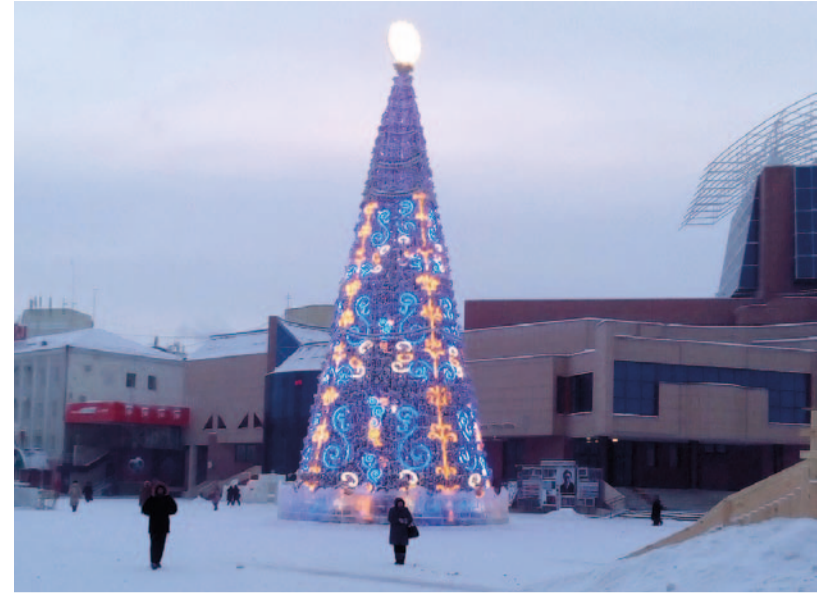
Uuden vuoden kuusi Ordzonikidzen aukiolta.