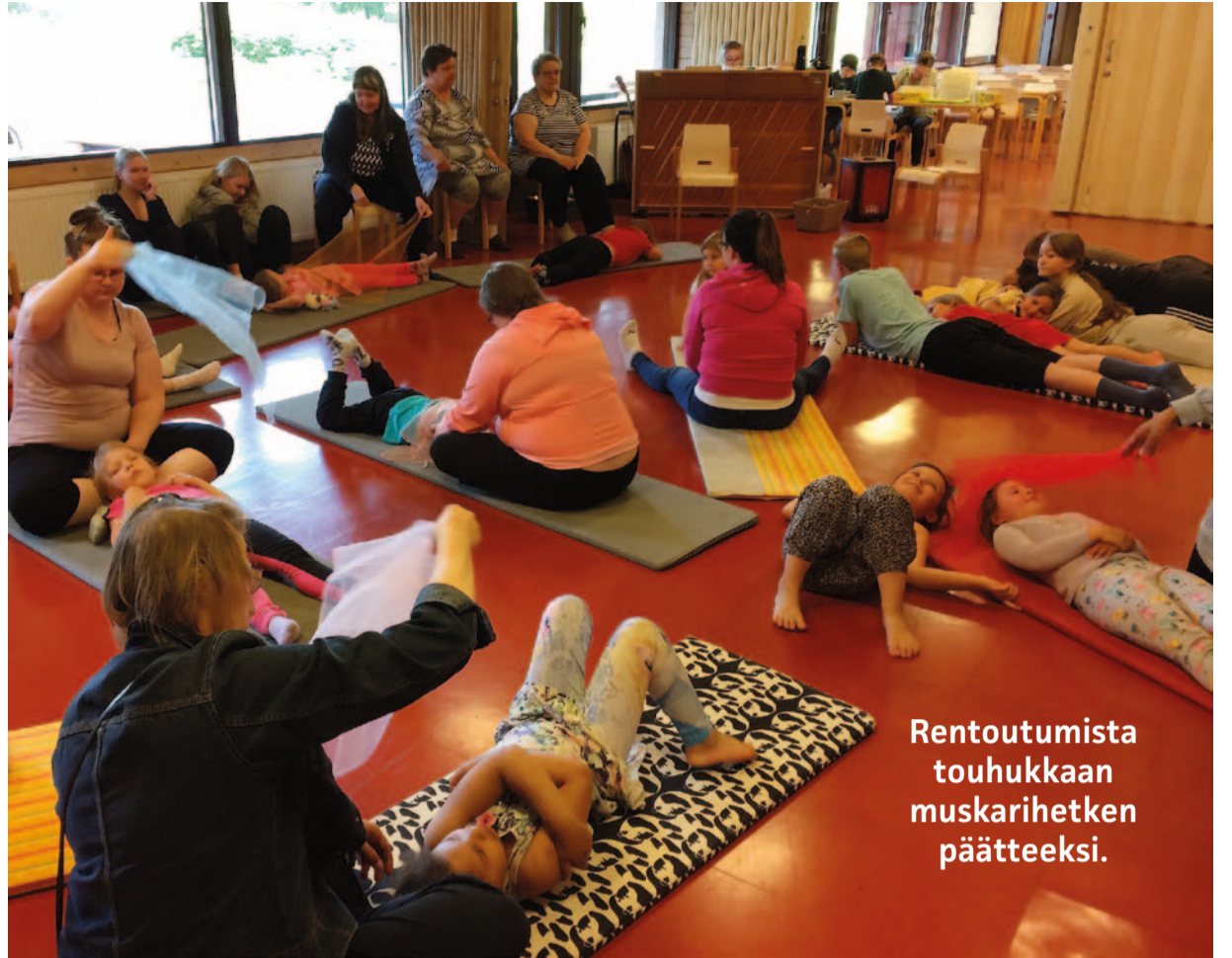
Rentoutumista touhukkaan muskarihetken päätteeksi.

Toivotan kaikille elämäänne terveyttä, rakkautta, rauhaa ja elämäniloa!