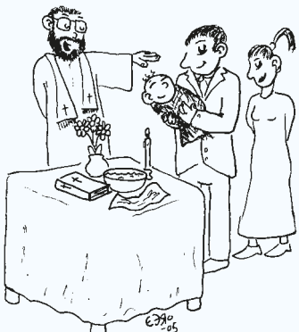
Taiteilijan näkemys ristiäisistä (piirros Eero Löytömäki)

Kahvitilaisuuden voi myös järjestää seurakunnan tiloissa. Kaste ei luonnollisestikaan maksa, mutta kahvitilaisuuden tilasta peritään vuokraa. Seurakunta päätti puolittaa tilavuokrat kasteperheiltä vuoden 2019 alusta. Pöytäliinat maksavat erikseen.