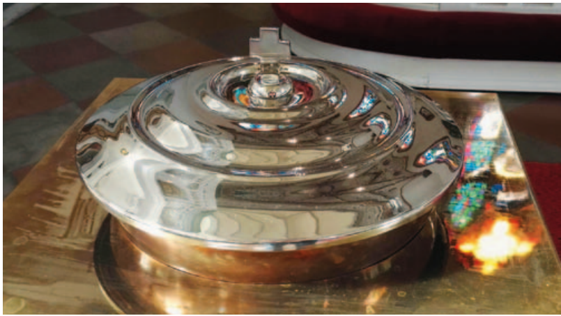
Forssan kirkon kastemalja.

Forssan seurakunnassa syntyneistä lapsista ylivoimaisesti suurin osa kastetaan, eli n. 80–100 lasta vuosittain. Syntyvyys on alentunut viime vuosina. Jokainen lapsi ansaitsee kuitenkin juhlan. Ristiäiset voi järjestää kotona, seurakunnan tiloissa tai muualla sopivassa paikassa. Joskus kesällä on oltu jopa ulkona puutarhassa.