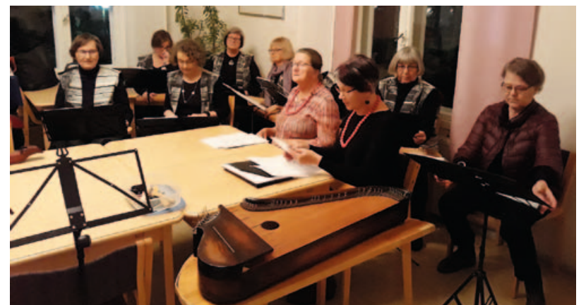
Yhteinen harjoitus Malmin seurakunnan Kanneltajien kanssa.