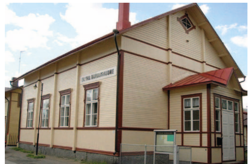
Sley Forssan rukoushuone Keskuskatu 9.

Rukoushuoneessa olemme saaneet olla toteuttamassa seurakunnan ykkösehtävää eli Herran lähetyksensä, henkilökohtaisena todistamisena ja osallistumisena maailmanlaajuiseen lähetystyö-