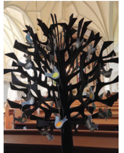
Kastepuu Forssan kirkossa.

saliin. Siellä oli hyvät keittiötilat, kahviastiat ja tarjoilutarvikkeet talon puolesta.