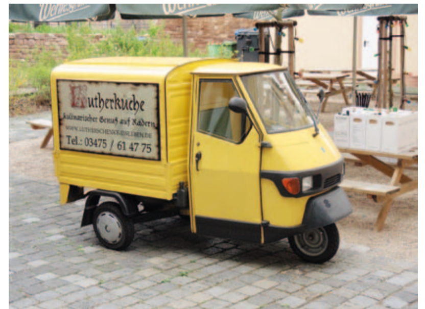
Luther tiedettiin hyvän ruoan ystäväksi, joten ”Luther-keittiö” palvelee asiakkaita.