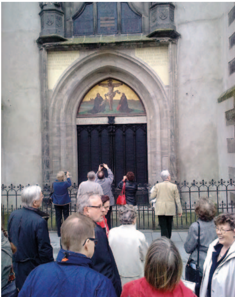
Turistit kuvaavat Wittenbergin kirkon ovea, jonne Lutherin kerrotaan naulanneen teesinsä.

Teksti: Kirkon tiedotuskeskus/ Esa Löytömäki