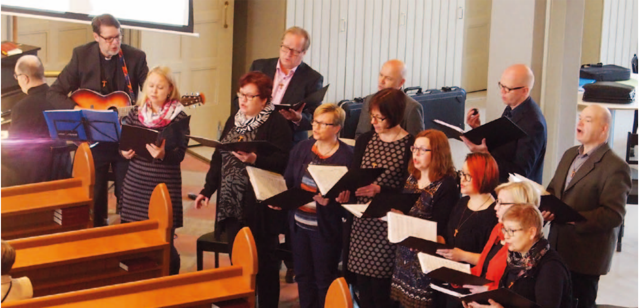
Palava pensas -lauluryhmä 2016 messussa. Vuorossa lisävihkon virsi 924, Kahden maan kansalainen.